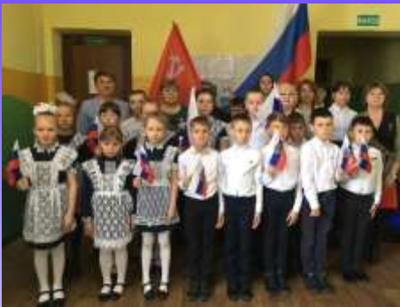
Ребята За с гостями торжественной линейки