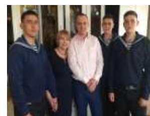
С сыном и внуками