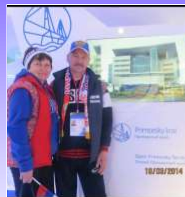
Сочи. 2014 г.