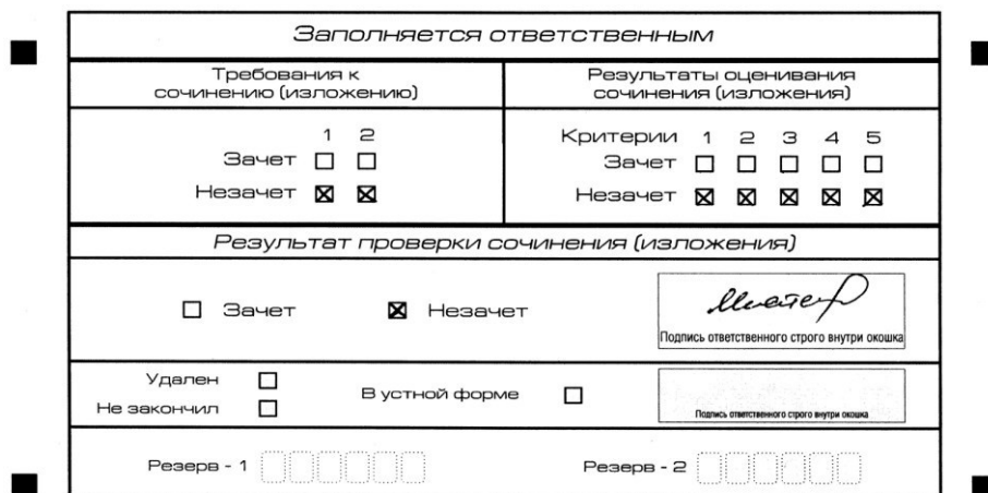
Рис. 1. Область для оценки работы

В клетки по всем требованиям (№ 1 и № 2) и критериям оценивания выставляется «незачёт». В поле «Результат проверки сочинения (изложения)» ставится «незачёт» (см. рис.1).