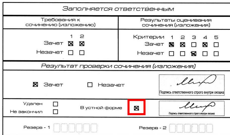
Рис. 4 Область для оценки работы сочинения (изложения) в устной форме